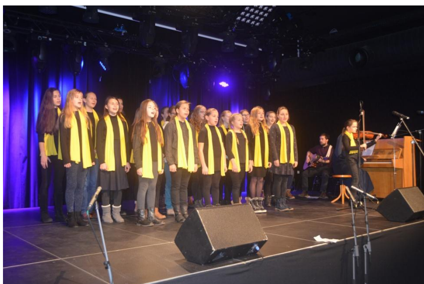
Žiaci základnej sv.Cyrila a Metoda, Košice detský spevácky zbor „RATOLEŠŤ“