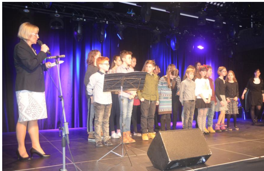
Spevácky zbor Bella ZŠ Gemerská 2, Košice spevácky zbor Bellas, spevácke pásmo