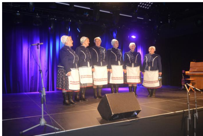
Únia nevidiacich slabozrakých Slovenska, stredisko Košice spevácka skupina „ŽIVENA“ - Moldava nad Bodvou